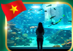
The Sea Shell Aquarium