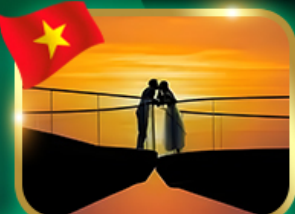
ชมอาทิตย์ตก ณ สะพานจู