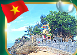
สักการะขอพรศาลเจ้าอ้อทิว