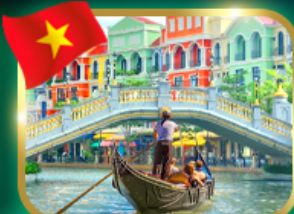
เวนิสจำลอง แกรนด์ เวิลด์