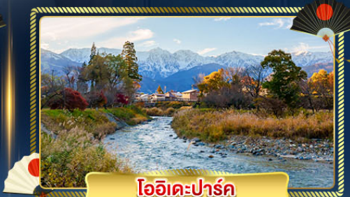
โออิวะเคะปาร์ค