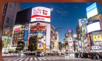
ซ้อปปิ้งชินจูกุ