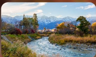
โออิเดะปาร์ค