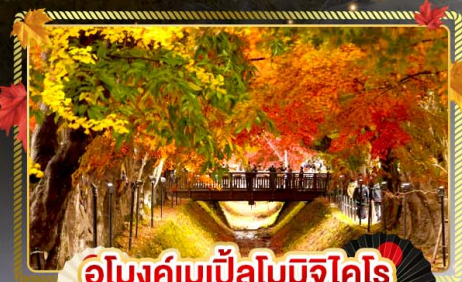
อุโมงค์เมเปิ้ลโมมิจิโคโร