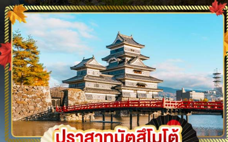
ปราสาทมิตสึโมโด้