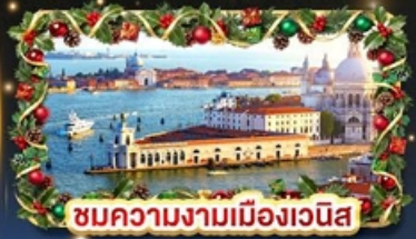
ชมความงามเมืองเวนิส

🛍 Outlet ช้อปปิ้งจัดเต็ม Last update PDF: 21-May-2026