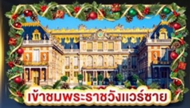
เข้าชมพระราชวังแวร์ซาย