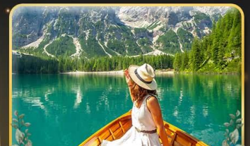
พายเรือทะเลสาบ Braies