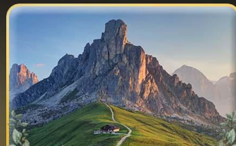
เยือน Passo Giau