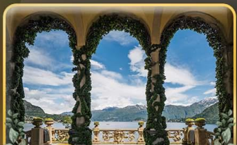
เชคอิน Villa del Balbianello

ที่สุดของธรรมชาติแห่งอิตาลี ทิวเขา ทะเลสาบ ความงามแห่งโดโลไมท์