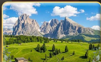
ชมวิวลังการ alpe di siusi