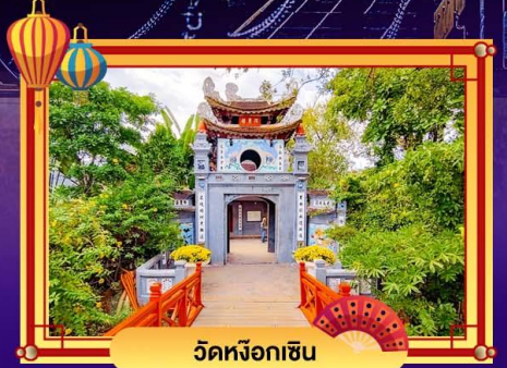
วัดหังอกเซิน