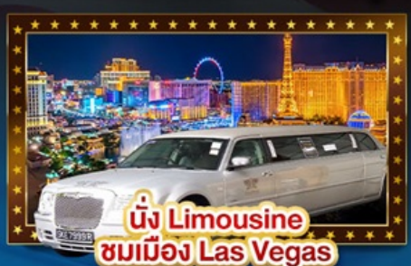
นั่ง Limousine ชมเมือง Las Vegas