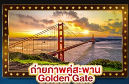
ถ่ายภาพคู่สะพาน Golden Gate