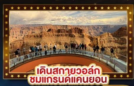
เดินสกายวอล์ก ชมแกรนด์แคนยอน