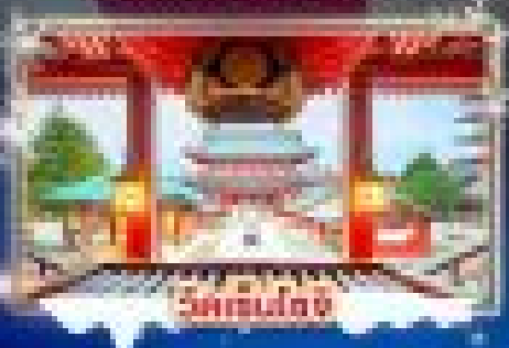
วัดชินโตจิ

เที่ยวชมงานประเพณีไฟตกน้ำ SAGAMIKO ILLUMINATION เช็กอินसानสกี ชมวิวภูเขาไฟฟูจิ