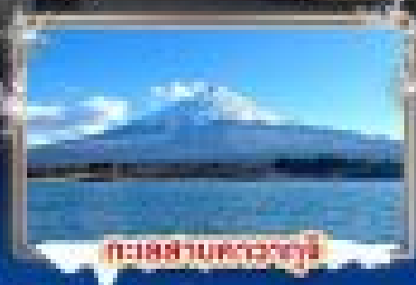
ทะเลสาบคาวะซุจิ