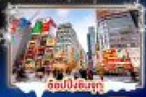
ตึกปีงอชิมา