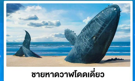
ชายหาดวาฬโดดเดี้ยว