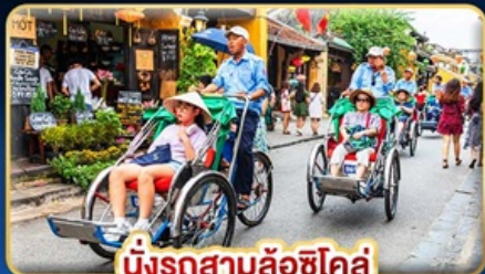
นั่งรถสามล้อฮิโคล