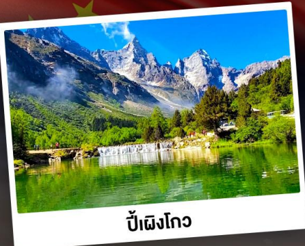
ปี้เฉิงโกว