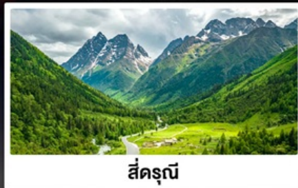
สี่ครุณี