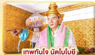
เทพทันใจ นัตโบบิย