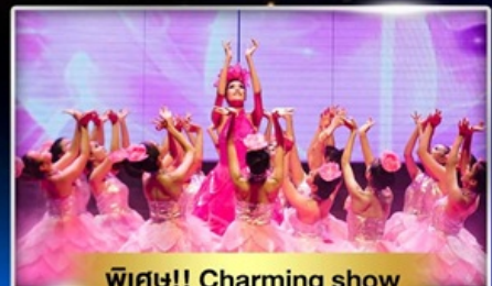
พีเศษ!! Charming show