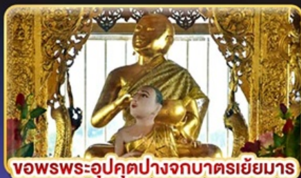
ขอพรพระอุปคุตปางจากบาตรเยี่ยมมาร