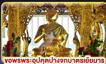
ขอพรพระอุปคุตปางจากบาตรเขี้ยว