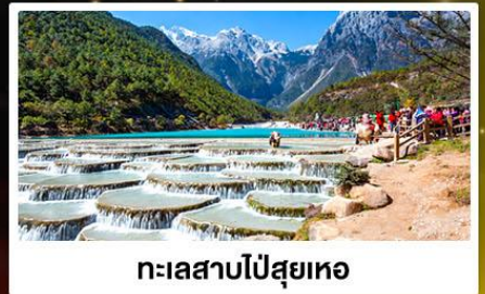
ทะเลสาบไป๋ซุ่ยเหอ