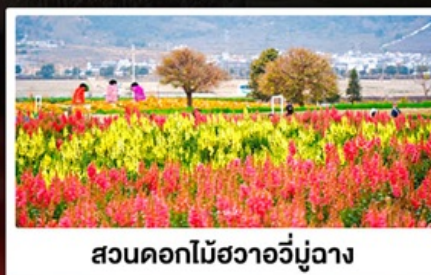
สวนดอกไม้สวาวีมีูฉาง