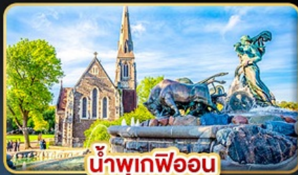
น้ำพุเทพีออน