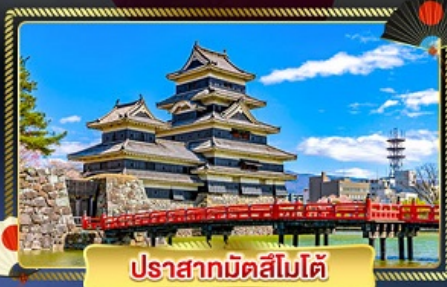
ปราสาทมัตสึโมโต้