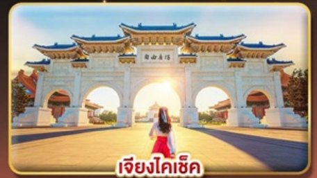
เจียงไคซีค