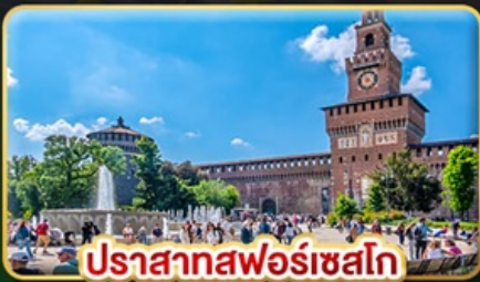
ปราสาทพnomเรอา

📅 เดินทาง : 28 พ.ค. - 06 มิ.ย. | 05-14 ส.ค. 15-24 ต.ค. 69