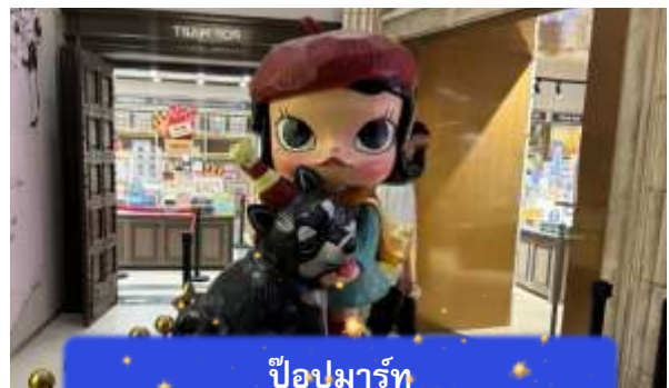
ป๊อปมาร์ท