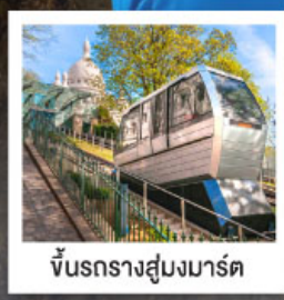
ขึ้นรางสู่สมมาร์ต