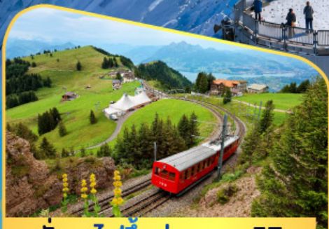
นั่งรถไฟขึ้นสู่ยอดเขาโรกิก