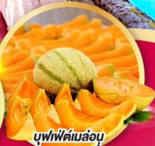
บุฟเฟ่ต์เมล่อน หอมหวานฉ่ำ