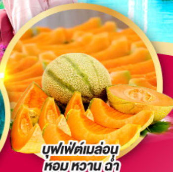
บุฟเฟ่ต์ผลไม้ หอมหวาน ฉ่ำ