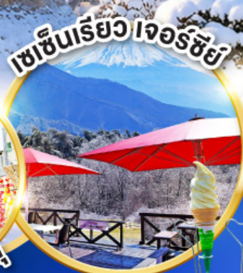
เซเช็นเรียว เจอร์ซี