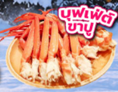
บุฟเฟ่ต์บายู