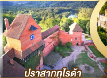
ปราสาทกูไรดา