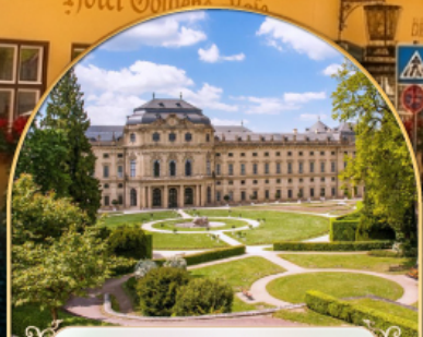
พระราชวังแวร์ซายส์ นคร ปารีส ฝรั่งเศส