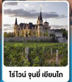
ไร่ไวน์ จุนยี่ เยียนไถ