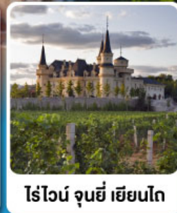
ไร่ไวน์ จุนยี่ เยียนไถ่