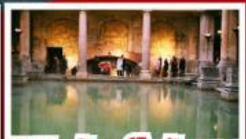
เยือนสโตนเฮ็นจ์ และ พิพิธภัณฑที่โรมันบาร