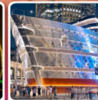
เรือหลุยส์