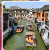
หมู่บ้านโบราณจูเจียเจียว