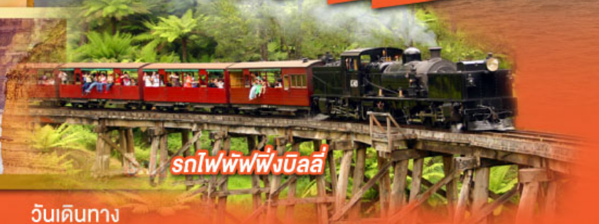
รถไฟพuffingบิลลี่