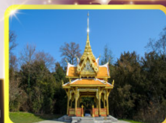
ศาลาไทยไชยานันท์