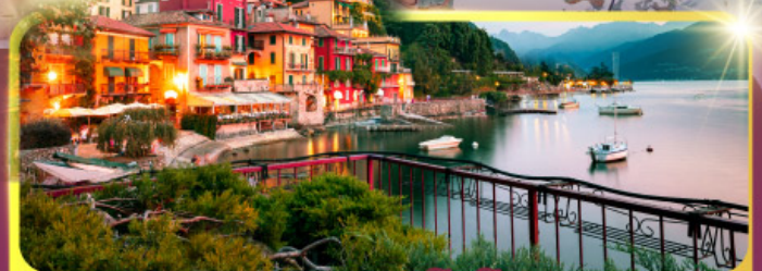
ทะเลสาบโลโคโม