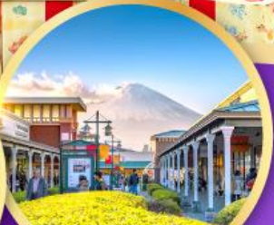
โกเทมบะ-พรีเมียมเอาลีต