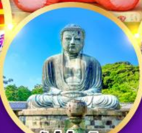
วัดโคโคคุอิน