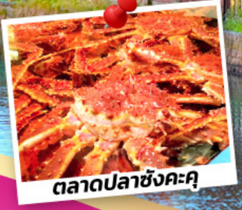
ตลาดปลาซังคะคุ

พักโอตารุ 1 คืน สัมผัสเสน่ห์สุดแสนโรแมนติก พักชิปปังโจ 2 คืน ช้อปปิ้งจุใจ