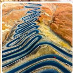
ถนนผานหลงกู่ต้าว