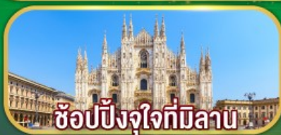
ช้อปปิ้งใจที่มิลาน

เดินทาง 07-14 เม.ย. 69 / 02-09 พ.ค. 69 27 พ.ค. - 03 มิ.ย.69 / 17-24 มิ.ย.69 22-29 ก.ค. 69 / 11-18 ส.ค. 69 16-23 ก.ย. 69