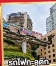
รถไฟฟ้า-ลู่ตีก