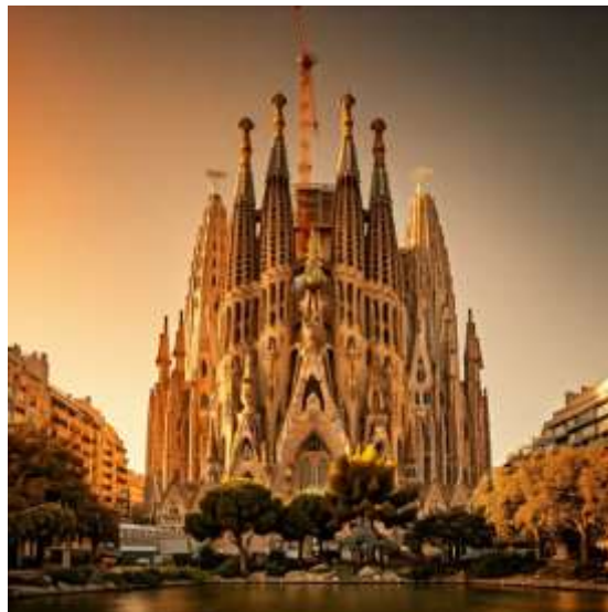
Sagrada Família barcelona spain

มหาวิหารซากราดาแฟมิลีย (Sagrada Família): สัญลักษณ์ของบาร์เซโลนาและผลงานชิ้นเอกของเกาดิที่ยังสร้างไม่เสร็จ แต่ก็สวยงามตระการตาด้วยสถาปัตยกรรมที่แปลกตาและรายละเอียดที่ประณีต