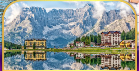
ทะเลสาบมิสุรีนา