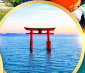
ทะเลสาบบิวะ เสาโทริอิ

เส้นทางสายอัลไพน์ทากายามา กำแพงหิมะ เขื่อนคุโรเบะ