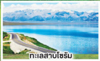
ทะเลสาบโซรัม