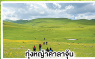
ทุ่งหญ้าคาลาจูน