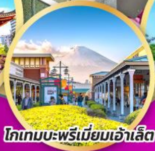
โทเกมบะพรีเมียมเฮ้าส์