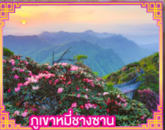
ภูเขาหมีชางซาน