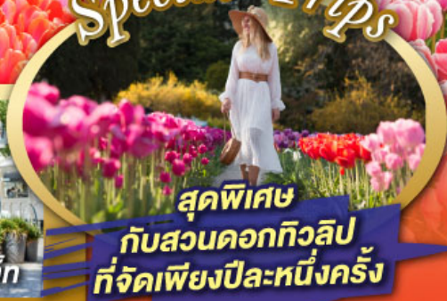
สุดพิเศษ กับสวนดอกทิวลิป ที่จัดเพียงปีละหนึ่งครั้ง