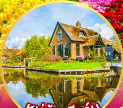
หมู่บ้านที่รูรัน