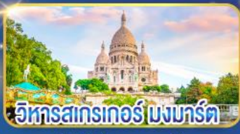
วิหารสตรกเกอร์ มงมาร์ต