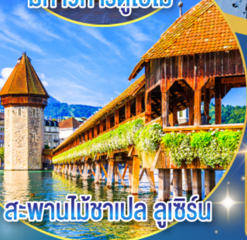
สะพานไม้ชาเปล ลูเซิร์น