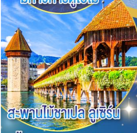
สะพานไม้ชาเปล ลูเซิร์น