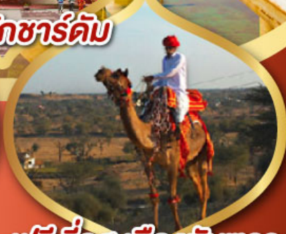
ฟรี ขี่อูฐ เมืองมันทวา ราคาเริ่มต้น