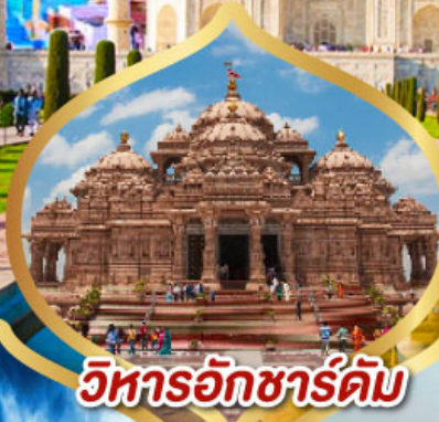
วิหารอักซาร์ดัม