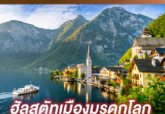
อิลสติกเมืองมรดกโลก