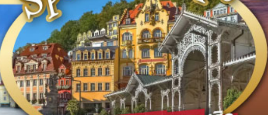
ชมสถาปัตยกรรมคลาสสิก เมือง คาร์โลวี วารี