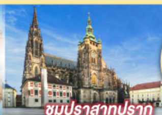
ชมปราสาทปราก