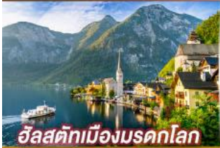
อิลสติกเมืองมรดกโลก