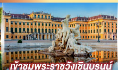
เข้าชมพระราชวังฮินบรุนน์