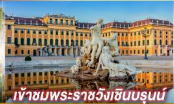
เข้าชมพระราชวังฮับส์บวร์ก