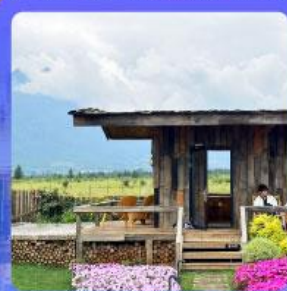
ร้านกาแฟหยุนตัน