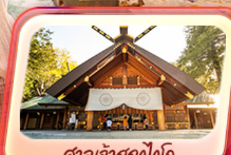
ศาลเจ้าซอกโกโด