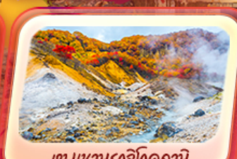
เขบเขนรกจิโกคุดานิ