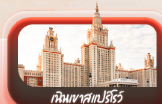
เนินเขาสเปร์ไร